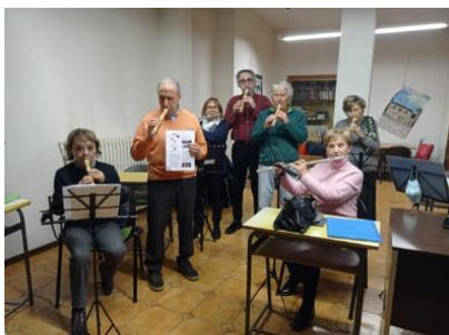
Bibbiena, Pratovecchio e Capolona-Subbiano sono le sedi nella splendida Valle del Casentino. Bibbiena