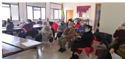
Monte San Savino è un'altra sede della nostra attività all'interno di un edificio storico nel centro di questa cittadina della Valdichiana